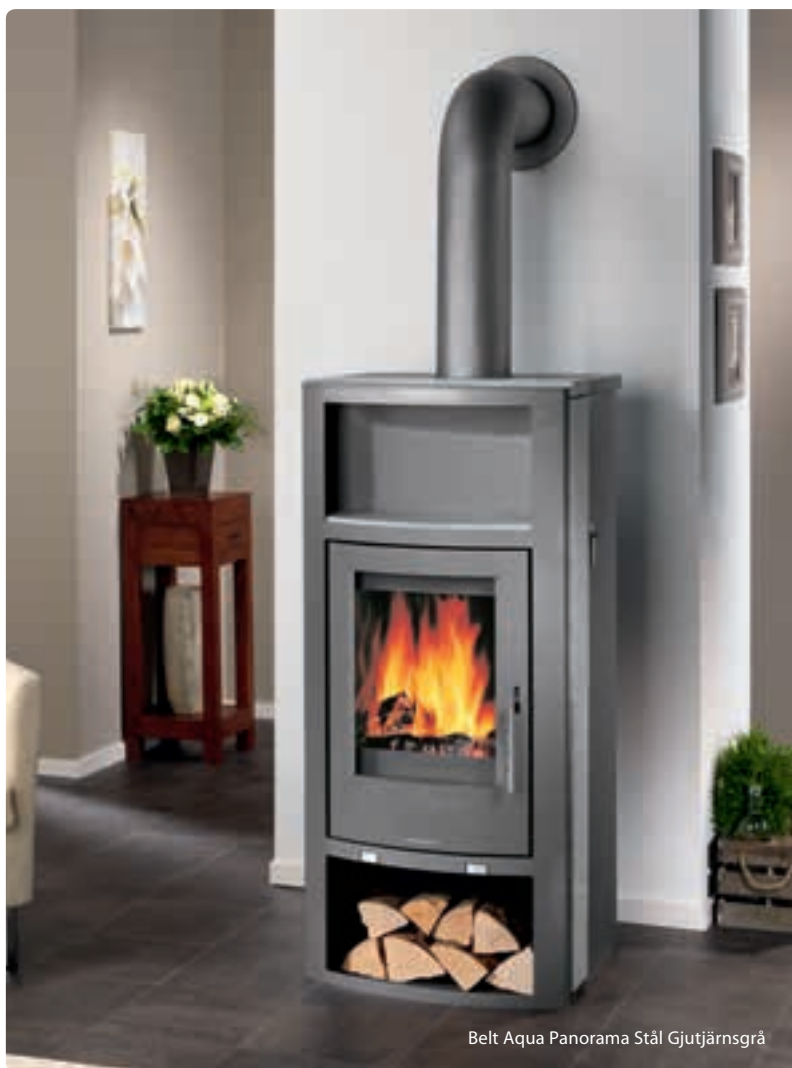
Belt Aqua Panorama Stål Gjutjärnsgrå