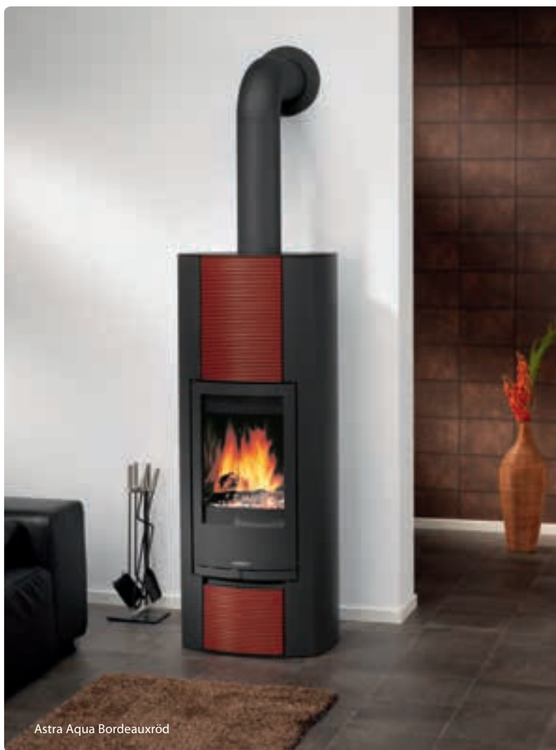
Astra Aqua Bordeauxröd